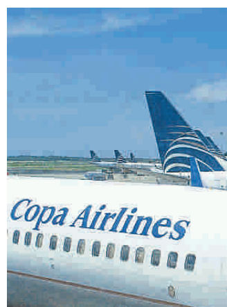
La aerolínea panameña refuerza su operación internacional.