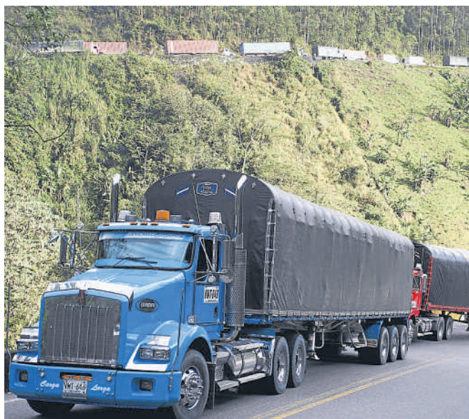
La obra entre Ibagué y Cajamarca deberá agilizar el tránsito de carga del centro del país al Pacífico.

la construcción de 35,1 kilómetros de segunda calzada entre Ibagué y Cajamarca, y el mantenimiento de 190 kilómetros del actual corredor que administra la Concesión Girardot-Ibagué-Cajamarca.