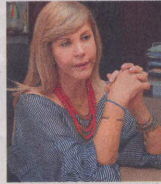
Gobernadora del Valle, Dilian Francisca Toro.

El Valle, por un aumento desmesurado de los gastos de funcionamiento, perdió