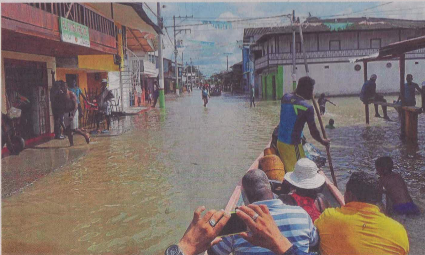
En embarcaciones se tiene que llegar a la vereda Imbilí porque las vías quedaron inundadas como consecuencia del invierno.