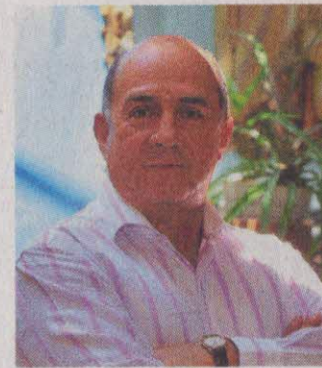
Ubéimar Delgado, exgobernador del Valle del Cauca.

la Categoría Especial en el 2010; en el 2012 se acogió a la Ley 550 o de Quiebras y en octubre del 2015 recuperó su Categoría Especial al Valle. Pero en septiembre del 2016, tras solicitud de la