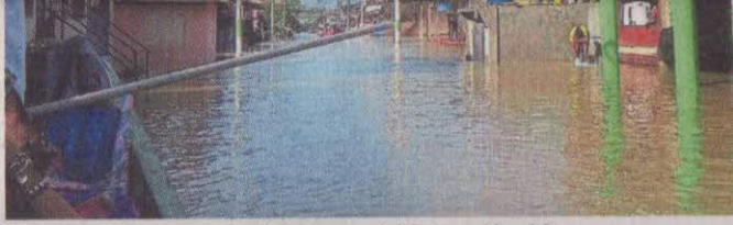
El río Mirá inundó las poblaciones del Bajo y Alto Mira.